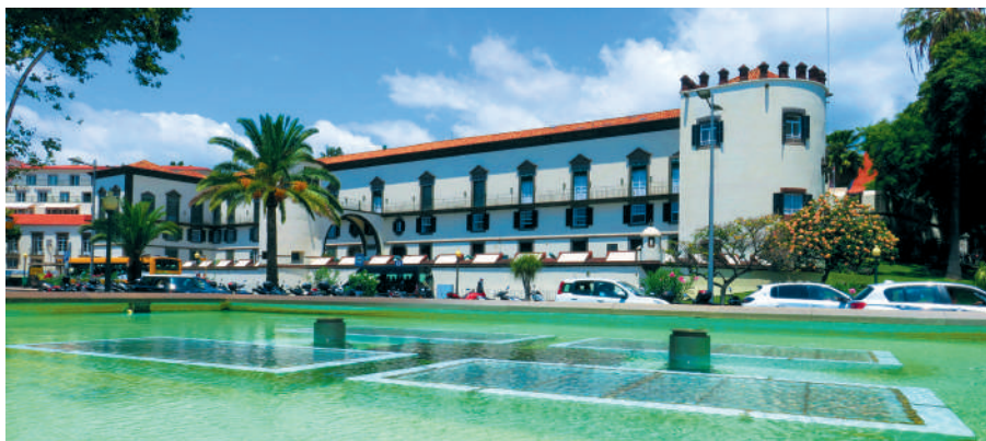
Figura constitucional que representa o Estado nas Regiões Autónomas, nomeado pelo Presidente da República, depois de ouvido o Governo da República. Tem como principais poderes assinar e mandar publicar os decretos legislativos e regulamentares regionais, exercer o direito de veto sobre a legislação emanada pelo Parlamento e solicitar a fiscalização da legalidade e constitucionalidade das respetivas normas jurídicas junto do Tribunal Constitucional, nos termos previstos na Constituição e no Estatuto Político-Administrativo da Região Autónoma da Madeira.